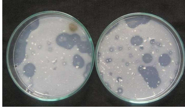
Hình 1: Phân lập các chủng vi sinh vật phân giải lân (tạo vòng trong bao quanh từ mẫu đất trồng chè của huyện Văn Chấn)