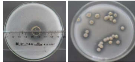
Hình 2: Kiểm tra hoạt tính phân giải lân bằng phương pháp đục lỗ thạch.

Các chủng vi khuẩn phân giải lân được kiểm tra hoạt tính bằng phương pháp định tính, đục lỗ thạch để lựa chọn những chủng có hoạt tính cao, hình ảnh và kết quả trình bày trong bảng 2 và hình 2.