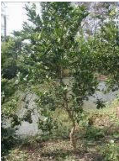
Hình 1: Cây cam sành không hạt LD6 3 năm tuổi