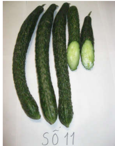
Tổ hợp TH4