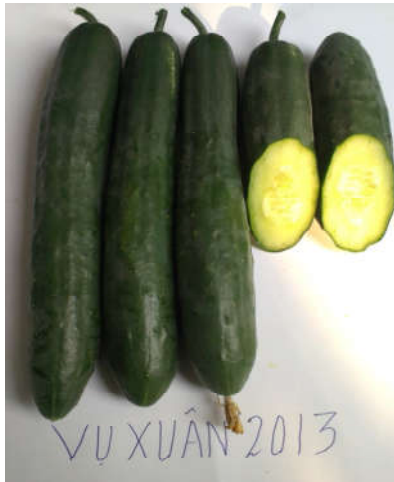
Tổ hợp TH1

- Tổ hợp lai TH4 có thời gian sinh trưởng 103 - 108 ngày, mức độ phân nhánh mạnh, màu sắc thân, lá, quả xanh đậm, gai quả màu trắng, quả dài 32 - 33 cm, đường kính quả 2,3 cm, cùi dày, đặc ruột, năng suất đạt 47 - 49 tấn/ha, phù hợp cho chế biến muối mặn.