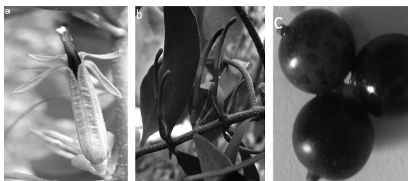
Hình 2. Ảnh hoa và quả tằm gửi

Khi hạt tạo vòi hút bám vào cây và hình thành nên cây con, cây con bắt đầu cần nước và chất dinh dưỡng từ cây chủ để có thể sinh trưởng tốt. Ngoài ra, chúng cần có một điều kiện thuận lợi về nhiệt độ và thời tiết cho sự sống. Qua theo dõi quá trình nảy mầm của cây tằm gửi nhận thấy rằng quá trình bám dính hình thành vòi hút và khả năng nảy mầm của hạt rất tốt. Hạt có thể nảy mầm trên bất cứ nơi nào thậm chí cũng có thể nảy mầm trên quả khác khi hạt rơi trên quả.