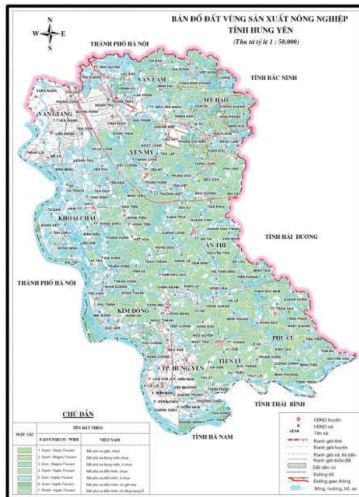
Hình 1. Bản đồ đất vùng sản xuất nông nghiệp tỉnh Hưng Yên thu từ tỷ lệ 1/50.000

Kết quả phân tích các chỉ tiêu dinh dưỡng và vi lượng của mẫu đất trồng bưởi tại Phúc Trạch, huyện Hương Khê được xử lý thống kê được thể hiện ở Bảng 1.