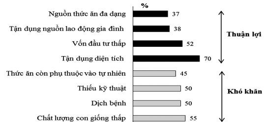
Hình 3. Thuận lợi và khó khăn của mô hình nuôi lươn (tỷ lệ%/tổng số mẫu, n = 60)

Mô hình nuôi lươn có thuận lợi như tận dụng diện tích có sẵn, nuôi bể lót bạt hay bể xi măng, thuận tiện chăm sóc và quản lý, đầu tư thấp và tận dụng các loại vật liệu có sẵn, lao động nhàn rỗi và thức ăn tự nhiên; khó khăn lớn nhất là chất lượng con giống, bệnh, kỹ thuật và thức ăn khó kiếm vào mùa khô (Hình 3).