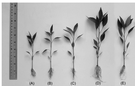
Hình 1. Cây ớt sau 24 ngày tuổi được xử lý với oligochitosan ở nồng độ 75 ppm

A: Đối chứng chỉ phun nước; B-E tương ứng là: phun oligochitosan có M_w \sim 11,40 kDa, M_w \sim 14,84 kDa và các phân đoạn M_w : 1-3 kDa và M_w : 3-10 kDa