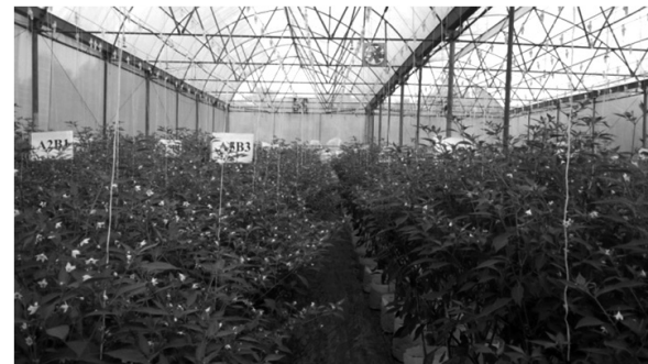
Hình 3. Hình thí nghiệm đánh giá khả năng gia tăng năng suất trái của cây ớt xử lý với phân đoạn oligochitosan