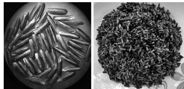
Hình 3. Gạo mầm và cơm gạo mầm

Cơm gạo mầm ngọt hơn cơm gạo lứt. Quá trình nảy mầm kích hoạt các enzyme hoạt động, chủ yếu là enzyme amylase thủy phân tinh bột thành đường đơn. Lee và cộng tác viên (2007) đã công bố sau quá trình nảy mầm tổng hàm lượng đường tự do của gạo lứt tăng từ 4 đến 9 lần do hoạt động của enzyme thủy phân tinh bột thành maltose, glucose và dextrin. Từ các kết quả đánh giá cảm quan về màu sắc, mùi, vị, cấu trúc nhận thấy gạo mầm làm từ gạo cẩm đã cải thiện được có cấu trúc và mùi vị tốt hơn so với mẫu gạo lứt (Hình 3).