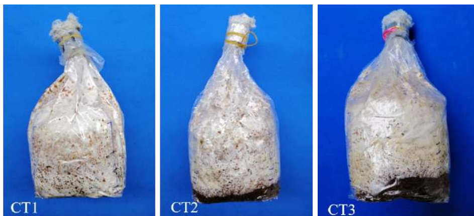
Hình 3. Hệ sợi nấm hương sau 35 ngày trên nguyên liệu mùn của phối trộn với các tỷ lệ các mạch khác nhau

Ngoài thời gian kín bịch thì thời gian hóa nâu và hình thành mầm quả thể cũng là yếu tố quan trọng trong để đánh giá khả năng hình thành và năng suất của quả thể. Thời gian hóa nâu càng nhanh thì hình thành mầm quả thể càng nhanh, thời gian thu quả thể sẽ diễn ra sớm hơn. Số liệu bảng 4 cho thấy CT1 có thời gian hóa nâu nhanh nhất chỉ sau 40 ngày sau cấy bịch nấm đã bắt đầu hóa nâu, 10 ngày sau khi hóa nâu bịch đã bắt đầu hình thành mầm quả thể. CT2 sau 46 ngày bịch mới bắt đầu hóa nâu, sau 58 ngày sau khi cấy bắt đầu hình thành mầm quả thể, CT3 có thời gian hóa nâu chậm nhất 60 ngày sau cấy một số bịch mới bắt đầu hóa nâu. Như vậy, CT1 có thời gian mọc kín bịch nhanh, cho số lượng quả thể trên bịch nhiều hơn CT1 và CT2 và đạt hiệu suất sinh học cao nhất 64%. Kết quả này cũng phù hợp với nhận định của Moonmoon và cộng tác viên (2011), nếu bổ sung các chất phụ gia vào cơ chất nuôi trồng theo tỷ lệ phù hợp giúp hệ sợi sinh trưởng nhanh, tăng năng suất sinh học, rút ngắn chu kỳ phát triển, tăng hương vị nấm hương.