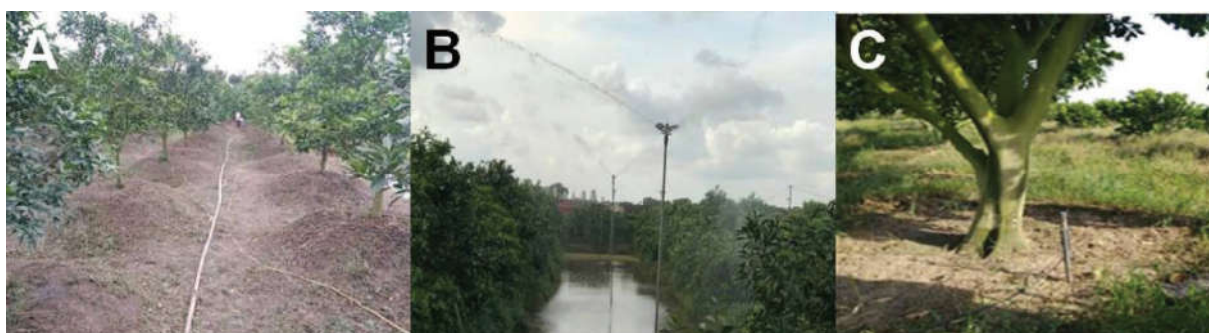
Hình 1. Khảo sát hạ tầng hệ thống tưới cam tại các mô hình trồng ở tỉnh Hưng Yên

kỳ kinh doanh có tán rộng nên nước khó tiếp cận vào vùng rễ quanh gốc cây, nhất là ở những hộ có mật độ trồng cam cao có hiện tượng tán chùm tán (Hình 1). Ở Hưng Yên, tỉ lệ các hộ sử dụng phương thức tưới phun mưa rất thấp do phần lớn các hộ trồng cam theo kinh nghiệm và chưa tiếp cận được với các công nghệ tưới hợp lý khác.